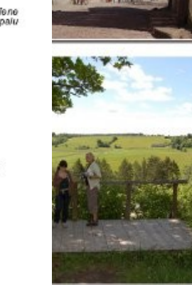
D klmā puvēlāpē

Veloms vienā dienā. Var doties divu r nakšpošanā kādā no ezera apkaimes Vidējas grūbties, jo liels grantēto ceļu nēram puse no kopējā garuma – ceļi ar ogunā Ispūki – Zosna – Bulāni – Čornaja – ta – Lomāši – Lipuškā – 280 km (caur Rēzekni) atēšs ī maršruts, kur atgrīežas sākuma punktā rdu var veikt arī pretējā virzienā vai sākt ietas. To var pagarināt līdz Māiņoklmām š no Lipuškām) un E. Valslēviskā ceplim lā īš – Krāslavas autoceļš (P 55) ir šaurš un Čornajas – Kaunatē posmā ir jābūti irīnītajiem ceļiem var būt „trepe”, bet lauku ziemeļu galā lētāns laikā var būt grūtāk pats ir atbūdijs par savu un savu bērnu sīkamas laika.