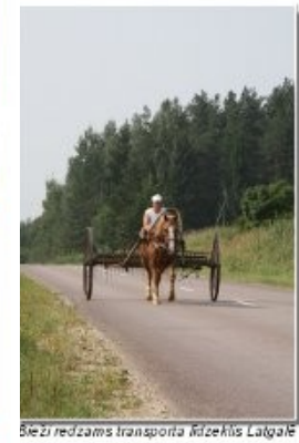
Ļēzi redzams transporta līdzeklis Laigalē

Veloms vienā dienā. Var doties divu r nakšpošanā kādā no ezera apkaimes Vidējas grūbties, jo liels grantēto ceļu nēram puse no kopējā garuma – ceļi ar ogunā Ispūki – Zosna – Bulāni – Čornaja – ta – Lomāši – Lipuškā – 280 km (caur Rēzekni) atēšs ī maršruts, kur atgrīežas sākuma punktā rdu var veikt arī pretējā virzienā vai sākt ietas. To var pagarināt līdz Māiņoklmām š no Lipuškām) un E. Valslēviskā ceplim lā īš – Krāslavas autoceļš (P 55) ir šaurš un Čornajas – Kaunatē posmā ir jābūti irīnītajiem ceļiem var būt „trepe”, bet lauku ziemeļu galā lētāns laikā var būt grūtāk pats ir atbūdijs par savu un savu bērnu sīkamas laika.