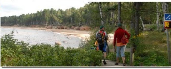
Veczemju (Veczemja) klmās

Šī ir ZBR piekrastē pieejamo servisu lapa un karte, kurā apkopoti šeit pieejamie pakalpojumi, kas var būt interesanti minētās teritorijas apmeklētājiem. Šī lapa noderēs ikvienam, kas ar kājām, velosipēdu, laivu vai ar savu auto dosies ceļojumā vai atpūtas braucienā pa Vidzemes piekrasti. Objekti un vietas ir sakārtotas un aprakstītas vizuāli no Dumtes (sākas ZBR teritorijā) līdz Ainažiem. Lapā iekļautajai informācijai ir nepieciešama regulāra aktualizācija, tādēļ priecāsimies par palīdzību jaunu faktu iegūšanā.