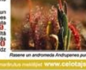
Rāznas ar andromē Andrupenes purvā notiek speciālais.