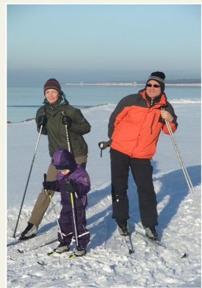
Slēpotāji jūras krastā