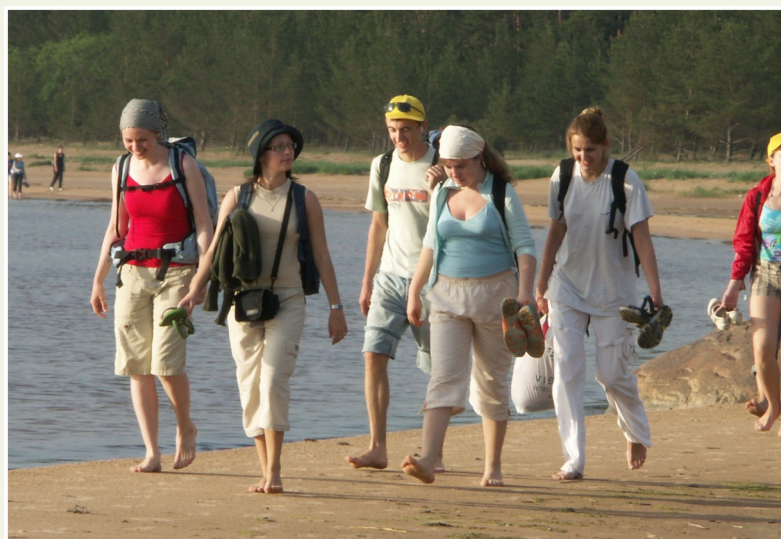
Pārgājiens gar jūras krastu