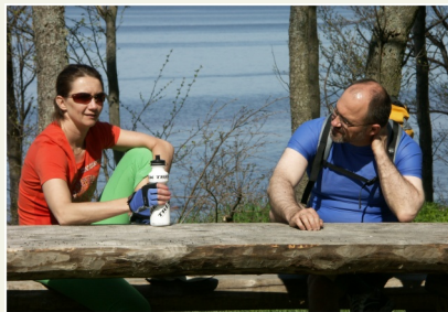
Atpūtas vieta jūras krastā

13 Tūjas ķieģeļu fabrika. Jau 1935. gadā Tūjā darbojās ķieģeļu ceplis, kas ražošanā izmantoja apkārtnē esošās Devona perioda mālu iegulas. 1936. gadā uzsāka jaunās fabrikas celtniecību. Šeit ražoja arī augstas kvalitātes ķieģeļus, ar kuriem apšūva, piemēram, Rīgas Pulvertorni. Fabrika ar pārtraukumiem darbojās līdz astoņdesmito gadu beigām. Tagad tās vietā ir pamests grausts, kas redzams no Tūjas centra, ejot jūras virzienā.