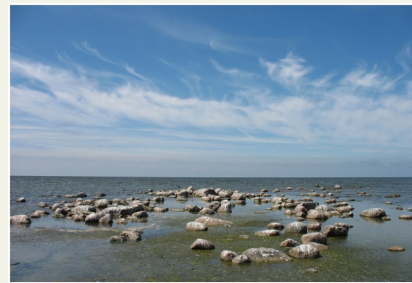
Laukakmeņu sakopojums krasta tuvumā