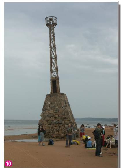
Ķurmraga vecās bākas paliekas