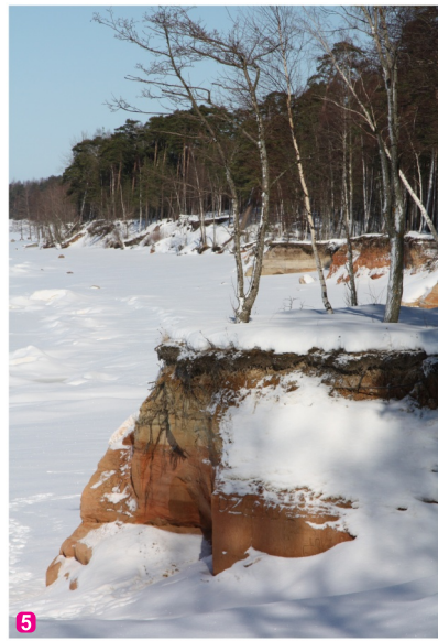
Veczemu klintis ziemā