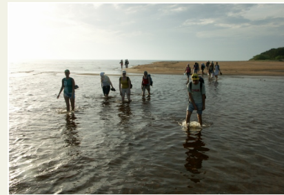
Vitrupe ieteka jūrā