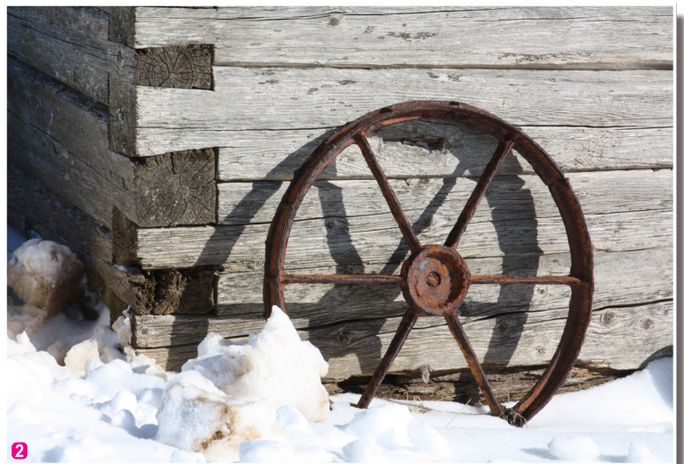
Vidzemes jūrmalas vēsturiskā apbūve

Citus aktīvā tūrisma maršrutus meklējiet www.celotajs.lv !