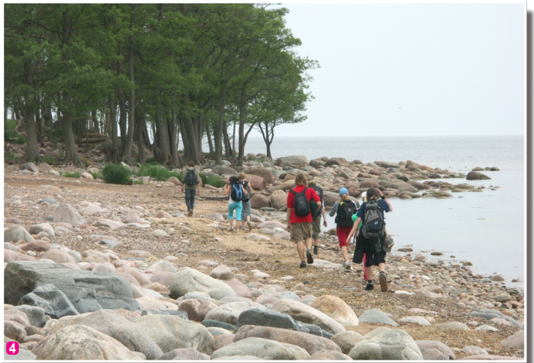
Pārgājiens gar akmeņaino jūrmalu

Vidzemes akmeņainā jūrmala ir ar dažāda lieluma laukakmeņiem klāts un nelieliem zemesragiem un līčiem izrobots Rīgas jūras līča austrumu krasta posms, kā arī vienīgā vieta Latvijā, kur jūras krastā, posmā starp Tūju un Vitupes ieteku un dienvidos no Tūjas jūras vilņu abrazīvās darbības iespējami izveidojušies līdz dažus metrus augsti Devona perioda smilšakmens atsegumi. Viens no izcilākajiem ir nepilnu puskilometru garās un līdz 4 m augstās Veczemu klintīs, kuru apkaime ir labiekārtota. Šis ir ļoti mainīgs un dinamisks jūras krasta posms, īpaši pēc lielām vētrām, kura aizsardzības nolūkos ir izveidots Vidzemes akmeņainās jūrmalas dabas liegums. Teritorija atrodas Ziemeļvidzemes biosfēras rezervātā.