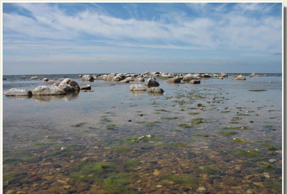
Laukakme u sakopojums krasta tuvum