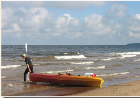
Braucienus uz kot T jās pludmal

11 Salaca – viena no nozīmīgākajām Baltijas jūras lašupēm un otra populārākā Vidzemes ūdenstūristu upe (sk. Salacas maršrutu). Tās lejtecē atrodas Salacgrīva .