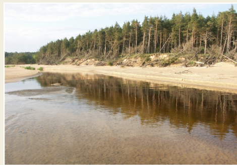
Vitrupe ieteka j r