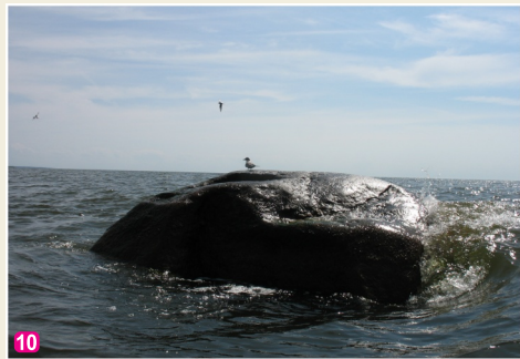
Lielais Krauju j r