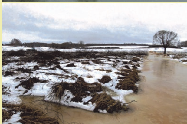
Ainava pirms un pēc krūmu izciršanas.

Februārī tika noslēgti trīs jauni līgumi par zālāju atjaunošanu, līdz ar to šosezon noslēgto līgumu skaits ir sasniedzis 14 un kopējā atjaunošanas darbu platība - 47,8 ha. Šajā mēnesī atkušņa ietekmē krūmu zāgēšana un izvešana vietām bija apgrūtināta. Līdz februāra beigām krūmu ciršana bija pabeigta apmēram 38 hektāros, darbi turpināsies līdz 31. martam.