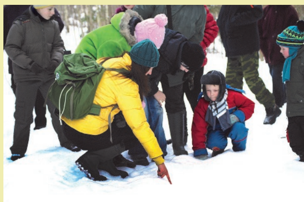
Vides klases nodarbība.