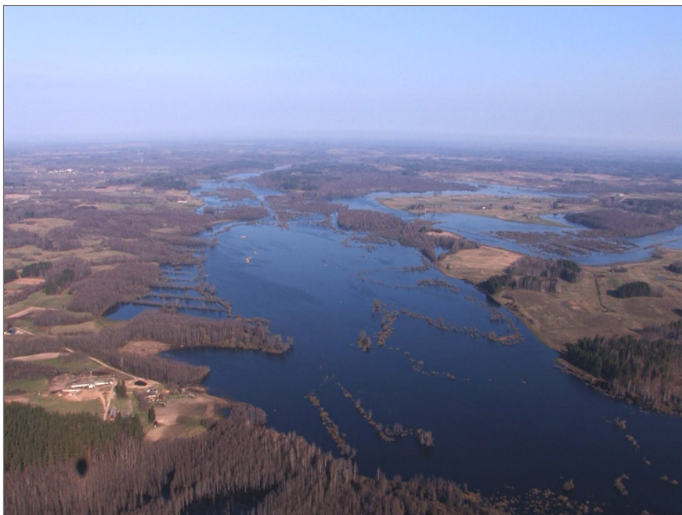
Skats uz Skuķu ezeru un pārplūdušo Dvietes upes palieni 23.04.2011.