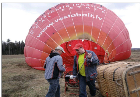
Kaspars Goba un Gints Gailis.

Dvietes palienes paplūdušajās plāvās pulcējās tūkstošiem ceļojošo putnu – zosis, pīles un bridējputni.