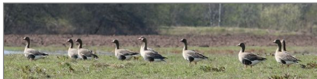
Baltpieres zosis Dvietes palienē.

pamatskolas bērni ar skolotājām vēroja palienē sastopamos putnus.