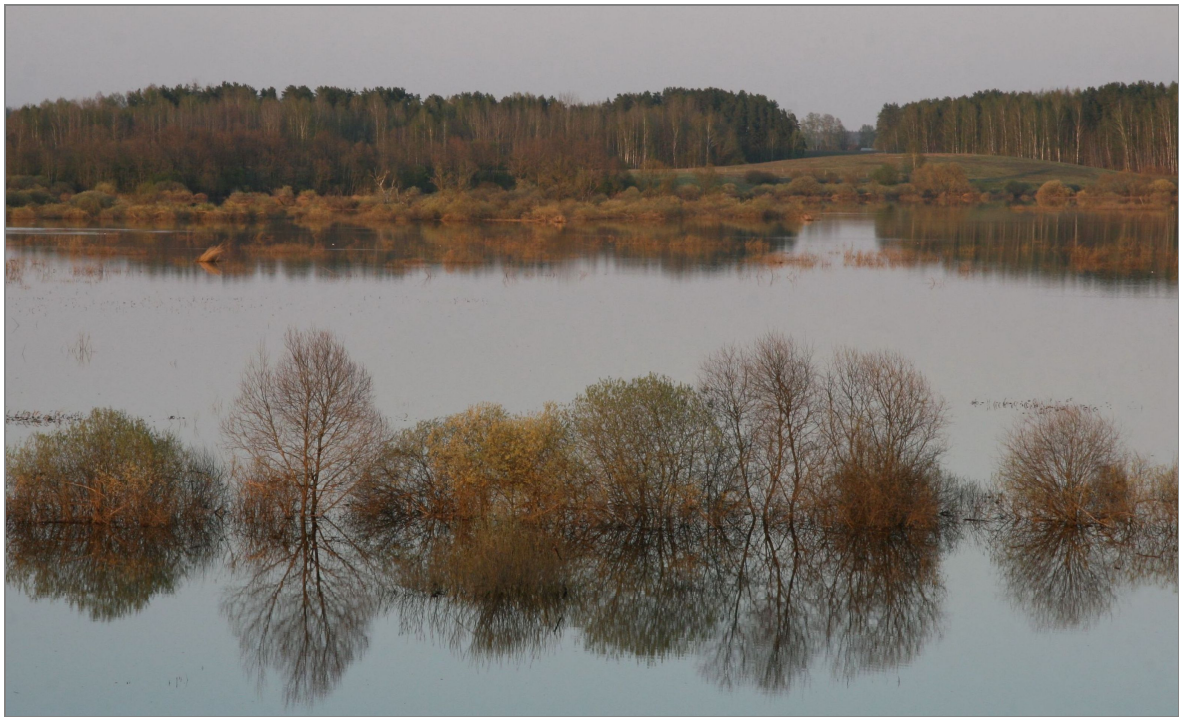
Skats uz Dvietes palieni no putnu novērošanas torņa 26.04.2011.