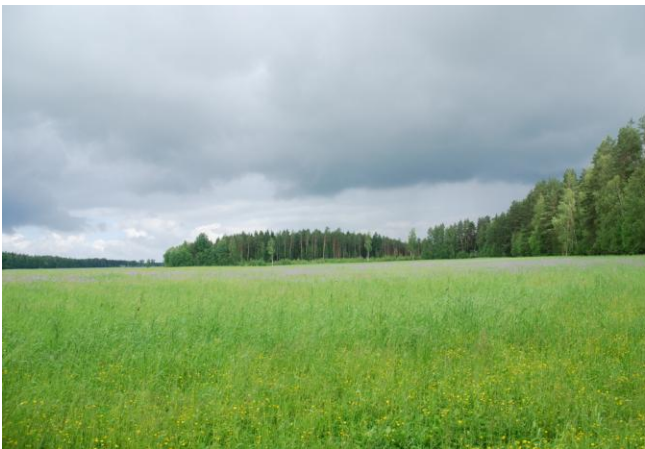
Plašās pļavas «Silkalnos»

Atklātajās platībās dominē dažāda vecuma zālāji, kas mijas ar košiem ārstniecisko augu stādījumiem. Zālāju un meža pārejas joslas saglabātas samērā platas. Tur vitālas audzes veido naktsvijoles un vāļīšu staipekņi. Platībās, kas ilgstoši izmantotas kā ganības, ieviesušās dabiskiem zālājiem raksturīgas augu sugas un veidojas daudzveidīgāka augāja telpiskā struktūra.