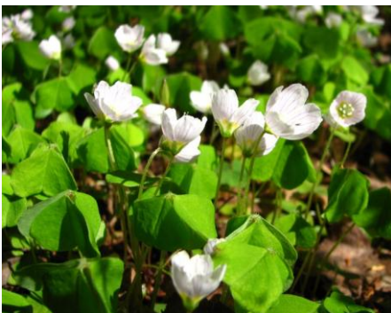
Pavasārī mežā un mežmalā zied zaķskābenes

Saimniecība ir specializējusies ārstniecības augu audzēšanā, vākšanā, kaltēšanā un pārstrādē. Pavairošanas vajadzībām siltumnīcā audzē ārstniecības augu stādus, kurus izstāda atklātajās platībās. Kopumā saimniecībā audzē vai savvaļā ievāc apmēram 160 ārstniecības augu sugu. Pārstrādātos produktus pēc tam izmanto dažādu citu produktu radīšanai, piem., tinktūru (RFF), sīrupu (Silvanols), krēmu, losjonu (Madara), smēru, pulveru un ekstratu (Fitosan), eļļu (Gatis Poišs), sulu (Fito preperāti), spilvenu, matraču u.c. un, protams, arī tēju ražošanai (dr.Tereško un Lauku tēja). Saimniecībā audzē - cūkas, govīs, aitas un mājputnus. Ir arī bišu saime.