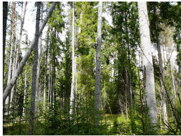
«Silkalnu» skujkoku mežs