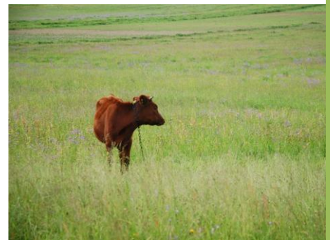
Augu sugām bagātās pļavas ir vērtīga barības bāze

«Silkalnos» ārstniecības augus, t.sk. ļoti grūti pavairojamus, izdiedzē no sēklām