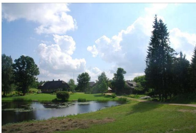
Skats uz ainavisko «Lielkrūžu» pagalmu

Saimniecība darbojas vairākos virzienos: zāgmateriālu, jumtu skaidu gatavošanā, gaļas liellopu audzēšanā, aitkopībā un bioloģiskajā dīķsaimniecībā ar 20 zivju sugām. Dabīgās ūdas palīdz atjaunot savvaļas zirgi. Lauksaimniecībā izmantojamās zemes lielāko daļu aizņem ūdas un ganības. Arāmzemē sēj miežus, griķus, rudzus, ziemas kviešus, zirņus, auzas, dārzeņus, stāda kartupeļus, ir iekopts augļu dārzs un ogulāju stādījumi. Pagalmā un starp dīķiem ierīkots daiļdārzs. Līdztekus tradicionālajai saimniekošanai būtisku vietu saimniecībā atvēl dažādu dabai draudzīgu ideju īstenošanai, kā arī ilgtspējīgu, uz tautas tradīcijām balstītas apsaimniekošanas un dabas kopsakarību novērošanai.