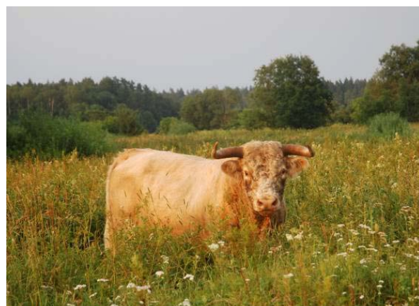
Zālāju apsaimniekošanā liela loma atvēlēta nogaišanai