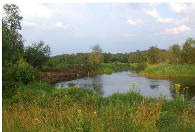
Gauja pie «Lielkrūzēm» ir samērā šaura, ar izteiktu palieni