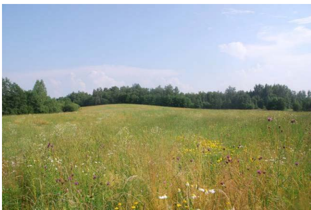
Gaujas palieņu pļavas «Lielkrūžu» apkārtnē ir plašas un lēzenas

Pēc saimnieku ierosmes saimniecībā pēc meliorācijas atjaunots viens Gaujas vecupes posms un būtiski uzlabota zālāja augu segas daudzveidība.