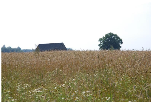
Graudaugu tīrumā izceļas savrupi ainavas elementi

Gan graudu audzēšanā, gan ‘Paradīzes ābolu’ saglabāšanā «Lejaskerzēnu» saimnieki izmanto jaunākos zinātnes sasniegumus augkopībā.