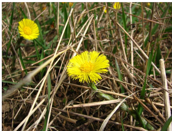
Māllēpes zied agrā pavasarī, savukārt auga lapas izaug vasarā