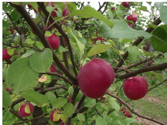
Ābolu rudens raža