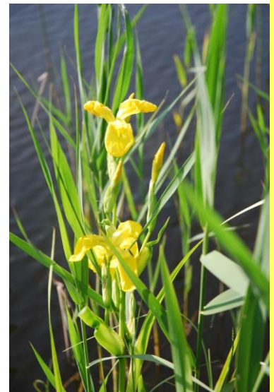
Purva skalbe dīķa krastā