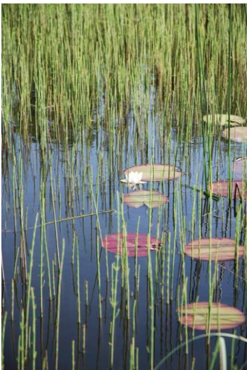
Dīķī plašas audzes veido upes kosa un sniegbaltā ūdensroze

Dabas parka „Talsu pauguraine” izteiktais reljefs nosaka ainavu daudzveidību - saimniecības teritorijā mozaīkveidā izvietoti augļu dārzi, zālāji, tīrumi, meži, mitrzemes, un tā piekļaujas Sirds jeb Sukturu ezeram. Šāda ainavas elementu daudzveidība tik nelielas platības ietvaros nosaka arī augstāku bioloģisko daudzveidību. Dabas daudzveidībai īpaši nozīmīgas ir mitrzemes un to saskares joslas ar sauszemi, mežmalas ar ozoliem un mežābelēm – vide, kas pirms vairākām desmitgadēm veidojusies ganīšanas ietekmē. Īpašs akcents saimniecības mežos ir liels ķiršu koku daudzums. Pateicoties saimnieku saudzīgajai attieksmei pret vidi, nelielās platībās sāk veidoties augu sugām bagāti zālāji ar naktsvijoļu audzēm.