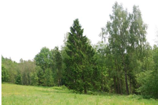
Plata pārejas josla no meža uz atklātām platībām ir bioloģiskajai daudzveidībai nozīmīgs faktors