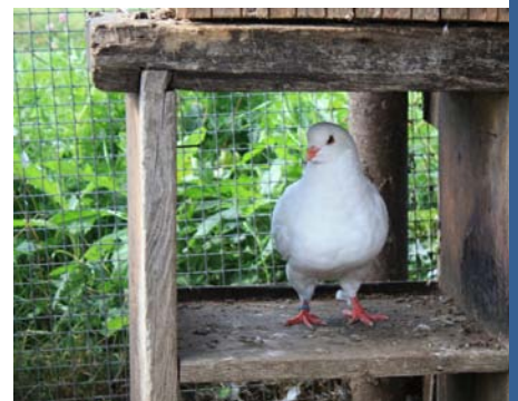
«Jaun-Ieviņās» audzē dažādus putnus, t.sk. baložus