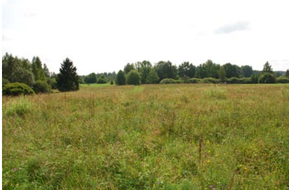
Zālājs ar koku un krūmu grupām

Mežu vērtības koncentrējas upītes ielejā. Tajā ir dabas daudzveidībai nozīmīga bebraine un meža nogabals ar ES nozīmes prioritāri aizsargājamu meža biotopu «Veci vai dabiski boreāli meži». Netālu no mājas lapsas izveidojušas ievērojama lieluma alu sistēmu.