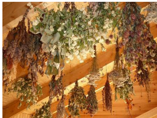
Saimnieki kaltē dažādus ārstniecības augus, kas izmantojami gan tējām, gan pirts procedūrām