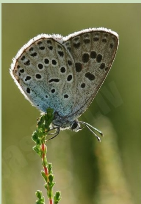
Lielais mārsilu zilenītis, 17.07., Ropažu nov.