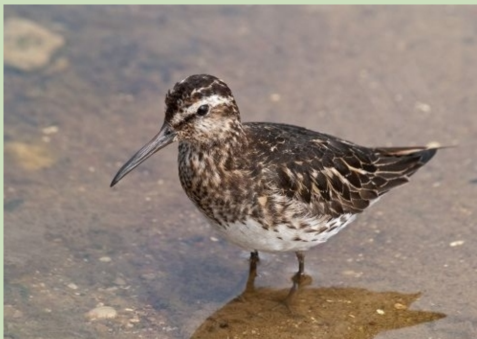
Dūņšņibītis, 31.07., Mērsraga jūrmala.