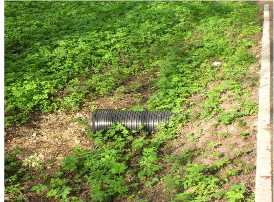
Ierīkotas caurtekas, tajā skaitā nefunkcionējošas.