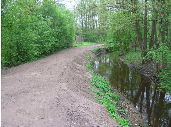
Iznīcināts Mārupītes krasts, pārveidojot to par meliorācijas grāvja atbērti. Pārveidojot krastu, cirsti koki.