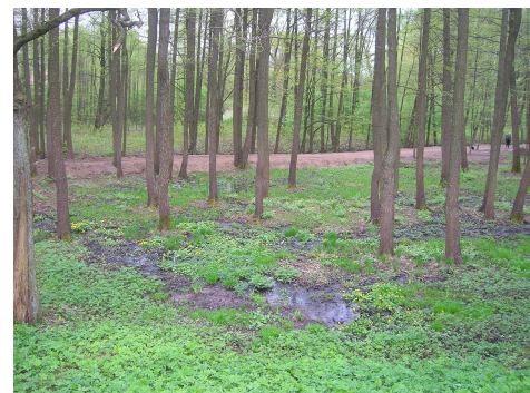
Ierīkotais uzbērumu norobežo melnalkšņu staignājus no upes.