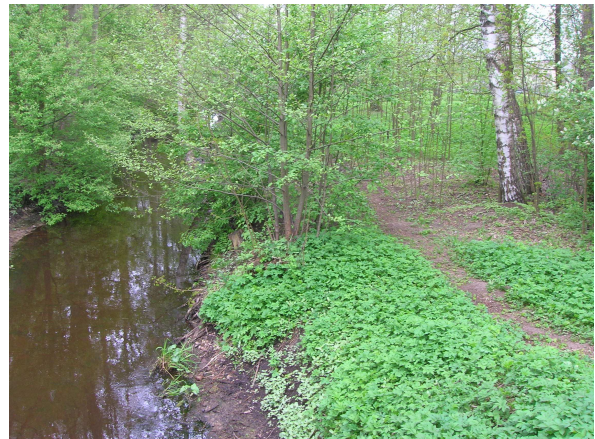
Mārupītes krastos iestaigātas šauras takas (0,5-1 m platumā).