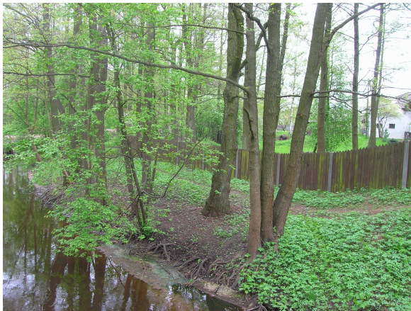
Nepārveidots Mārupītes krasts.