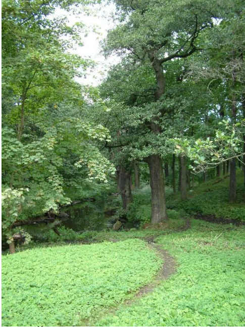
Šaura taka Mārupītes ielejā.

Melnalkšņu staignājs ar raksturīgo ciņu – pārplūstošu lāmu kompleksu.