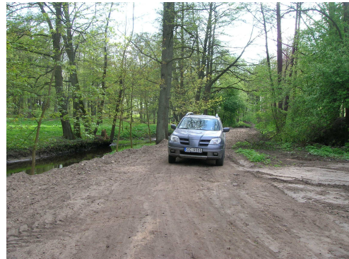
Ierīkotais velosceļņa uzbērumš ir 4-6 metrus plats.