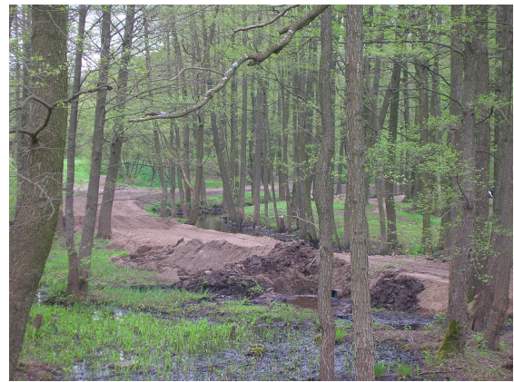
Skats uz ierīkoto uzbērumu melnalkšņu staignājā pie Mārupītes. Ierīkojot uzbērumu, cirsti koki un pilnībā iznīcināts melnalkšņu staignājs uzbēruma vietā.