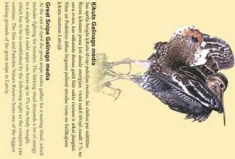
Great Snipe Gallinule At the end of April the great snipe migrates from the north to the south. In Latvia it breeds in the swamphes and in the wetlands of the Natura 2000 area. The conservation plan for the snipe is to create wetlands for the snipe in the Sitas and Pededzes Paliene.